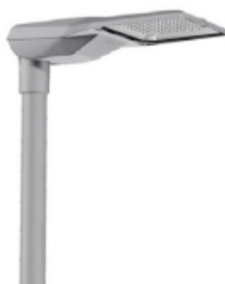
Obr. 2 – vzhled VO (příloha Žádosti o závazné stanovisko).