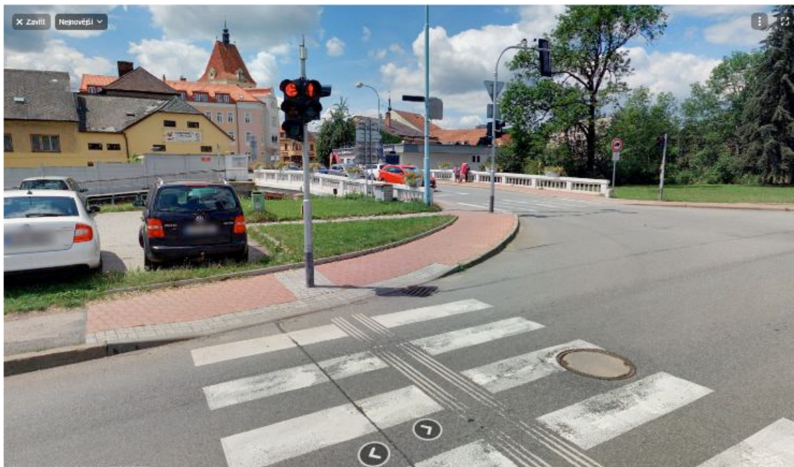
Obr. 1 – již užitá červená dlažba na křížení řešené ulice s ulicí Václava Petrů (mapy.cz, datum: 7/2022).